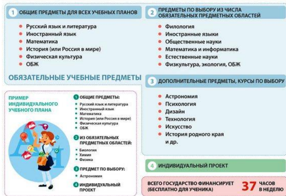
Рисунок 1. Формирование учебного плана

Новые стандарты вводят и перечень обязательных предметов Единого государственного экзамена. Их станет три: к привычным уже математике, русскому языку и литературе, добавляется экзамен по иностранному языку.